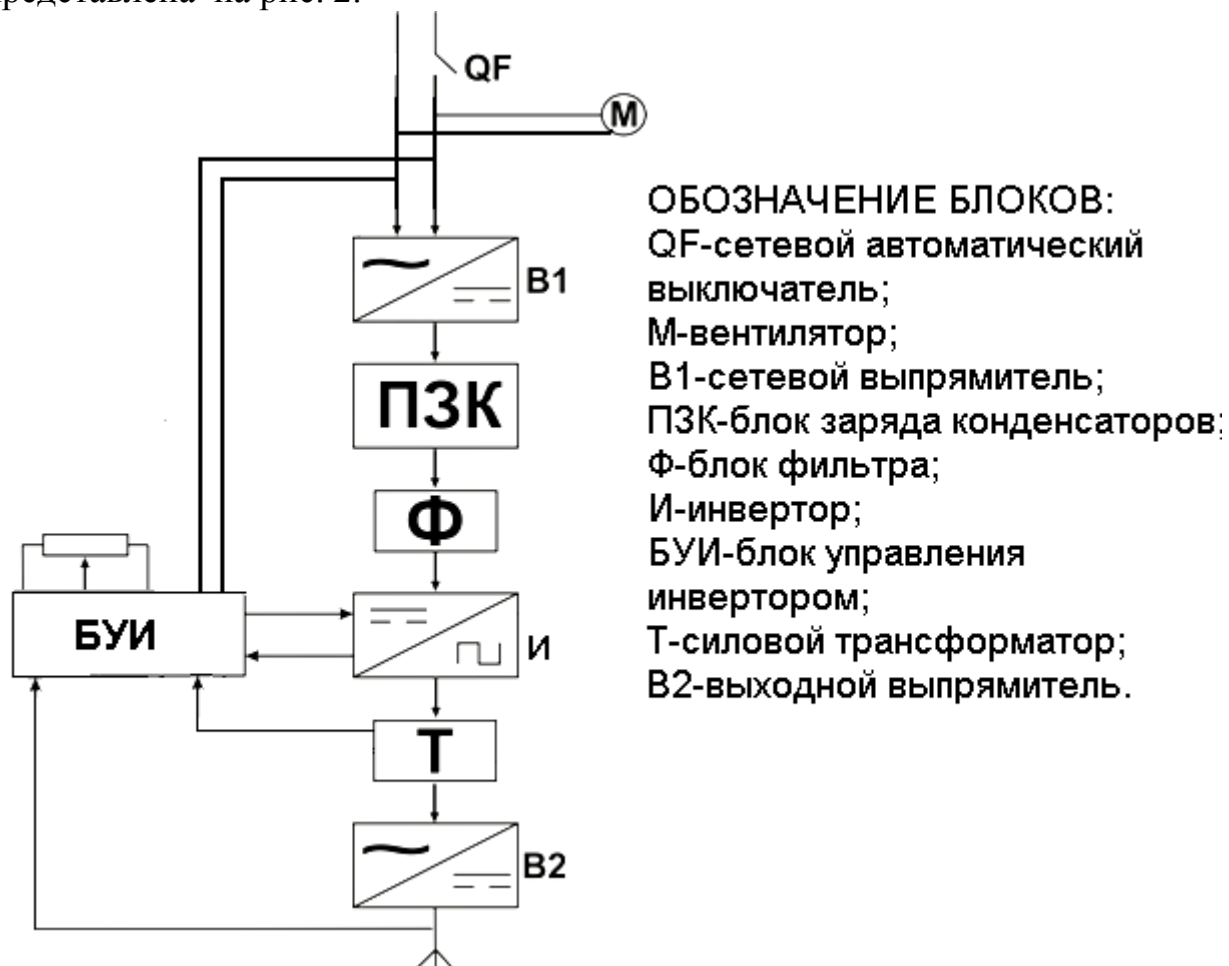
Рис.2 Обобщенная структурная схема выпрямителя.

Обобщенная структурная блок-схема выпрямителей типа «ВД-200ИМ УЗ» представлена на рис. 2.