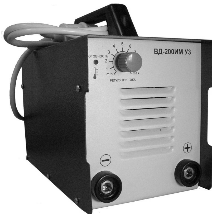
Рис 1. Внешний вид выпрямителя сварочного инверторного типа (рис.1)

1.6. Выпрямитель обеспечивает повышенную безопасность за счет ограниченного до 62В напряжения холостого хода. При этом сохраняются сварочные свойства аналогичные аппаратам с напряжением холостого хода 90В.