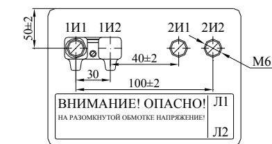
Рисунок Б.1 Трансформаторы тока ТШЛ-20-1