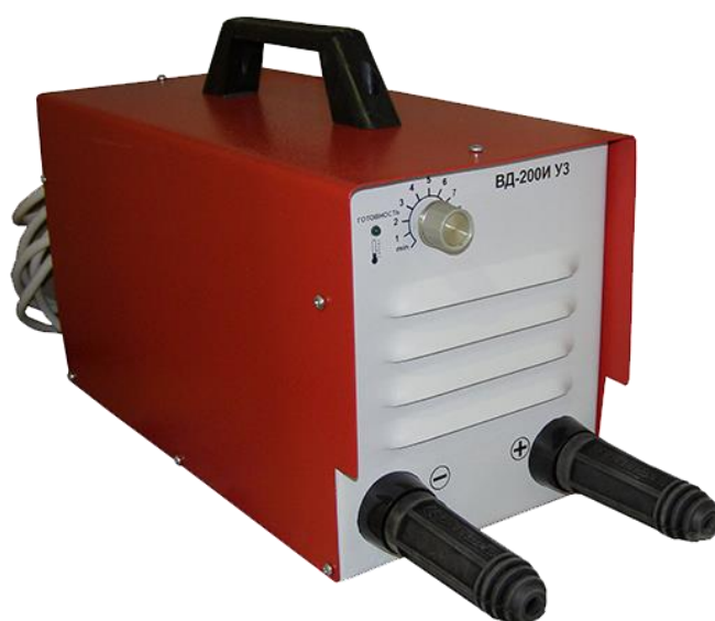
Рис 1. Внешний вид выпрямителя сварочного инверторного типа (рис.1)

1.6. Выпрямитель обеспечивает повышенную безопасность за счет ограниченного до 62В напряжения холостого хода. При этом сохраняются сварочные свойства аналогичные аппаратам с напряжением холостого хода 90В.