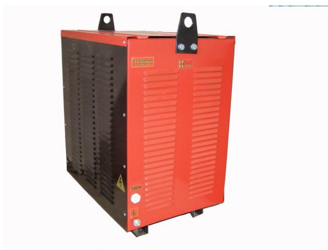
Рисунок 1. Общий вид трансформатора

Трехфазный Сухой Защищенное исполнение Разделительный Номинальная мощность в киловольт-амперах Вид климатического исполнения по ГОСТ 15150-69