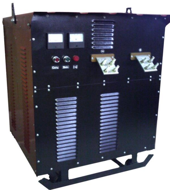
Рис 1. Общий вид выпрямителя

1.4. Не допускается использование выпрямителя для работы в среде насыщенной пылью, во взрывоопасной среде, а также в среде, содержащей едкие пары и газы, разрушающие металлы и изоляцию.